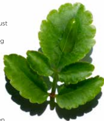
Goethe Pflanze Feuchtigkeitsspendender Aktivstoff

Von gestresster Haut über Spannkraftverlust bis hin zu hormoneller Veränderung: nach dem Hautcheck wird die Pflegebehandlung auf die individuellen Bedürfnisse der Haut, wie mehr Hautdichte und Ausstrahlung, mehr Festigkeit und Elastizität oder mehr Energie und Schutz gegen Hautstress sowie auf Ihre persönlichen Schönheitswünsche abgestimmt. Vom Alter unabhängig, reduziert diese Behandlung sichtbar Fältchen sowie Falten und glättet die Gesichtszüge. Die Haut ist straffer und gestärkt, der Teint erstrahlt.