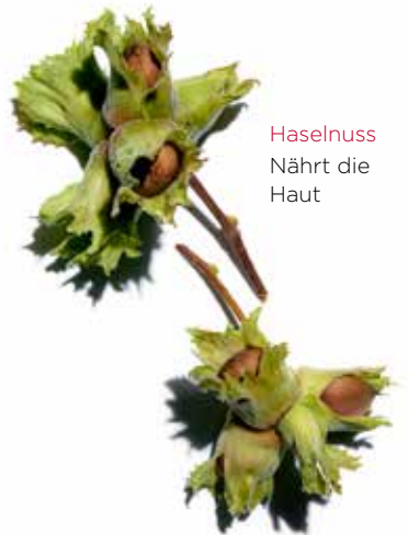
Haselnuss Nährt die Haut

Entstauende und entlastende Bein & Fussmassage mit Frischeeffekt. Für ein freies, leichteres Beingefühl.